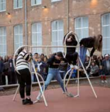
Playground Scene (2017). Laia Estruch. EN RESIDÈNCIA en el Instituto Juan Manuel Zafra